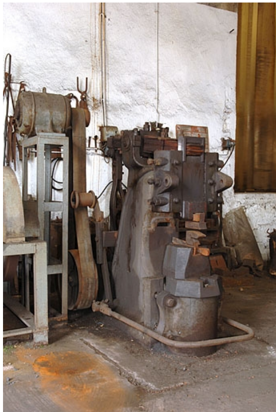
Vue d'ensemble de trois quarts gauche.

70, Corravillers R.D. 6, lieudit : Champs Fauvey