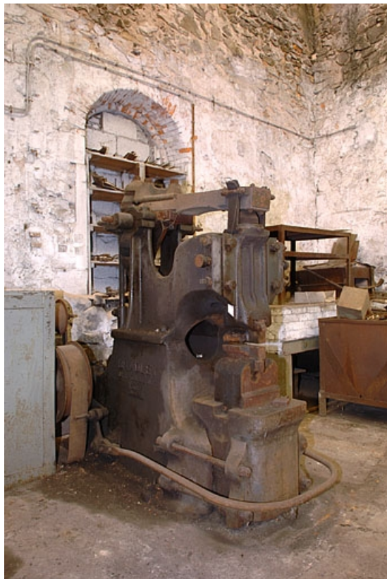
Vue de trois quarts gauche.

70, Corravillers R.D. 6, lieudit : Champs Fauvey