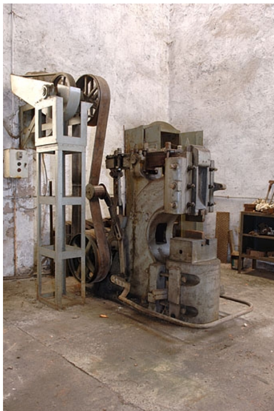
Vue d'ensemble de trois quarts gauche.