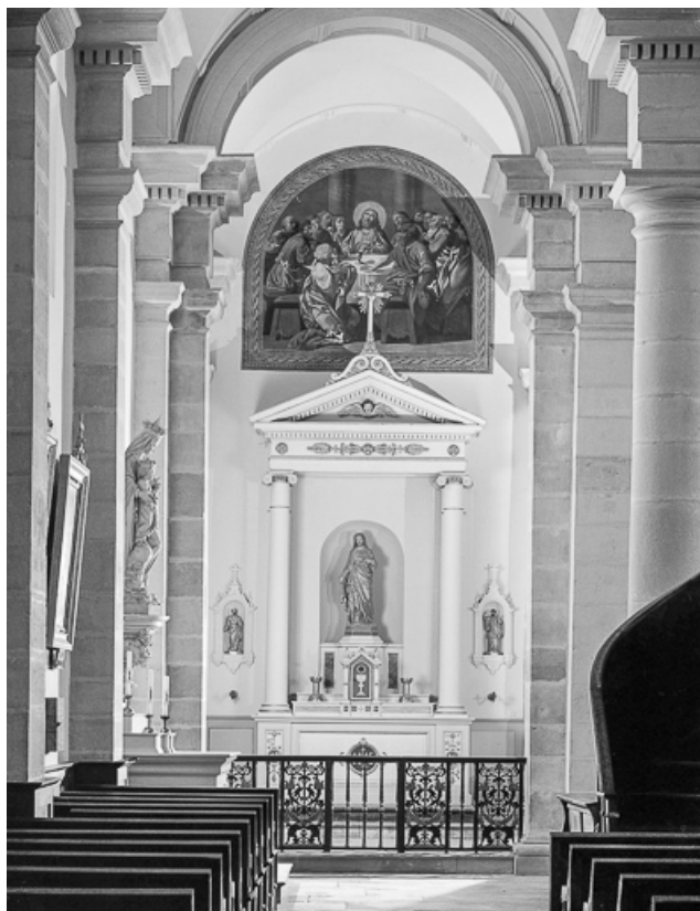
Vue d'ensemble de l'autel-retable gauche.