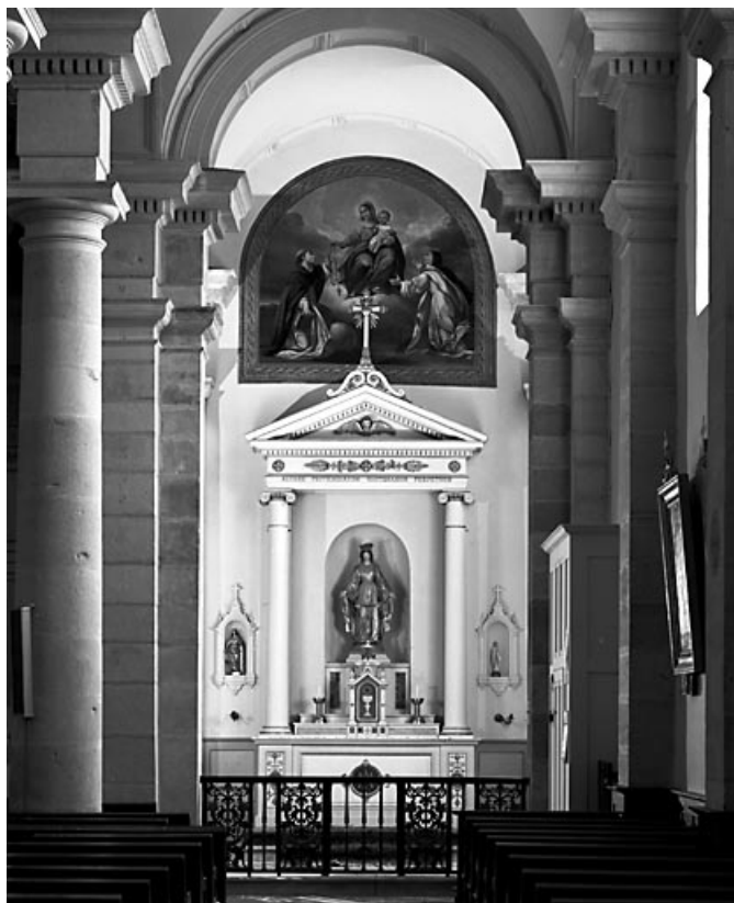
Vue d'ensemble de l'autel-retable droit. 70, Valay