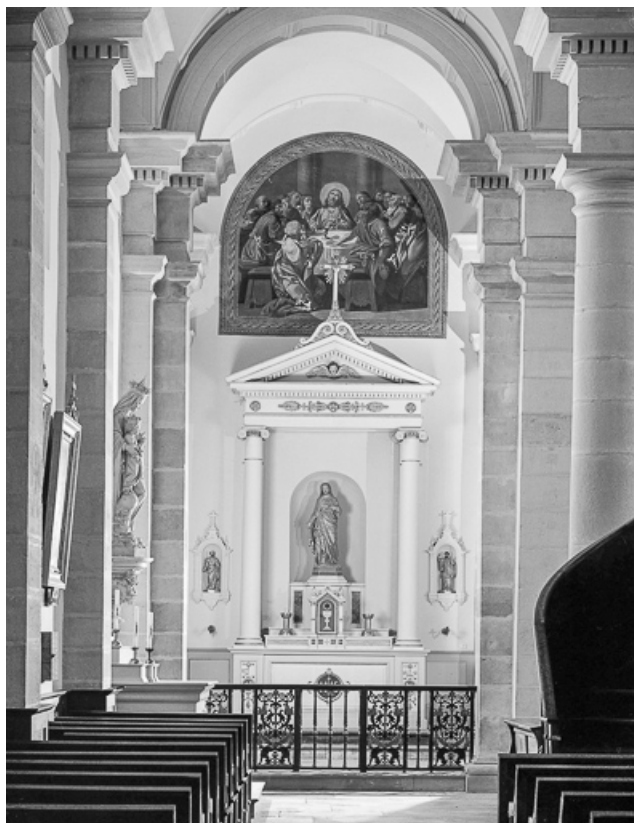
Vue d'ensemble de l'autel-retable gauche. 70, Valay