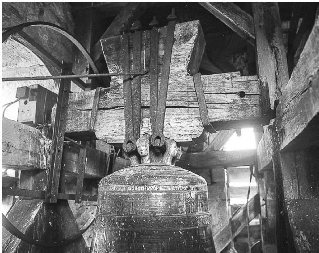
Vue de la partie supérieure.