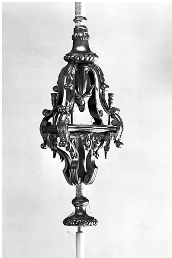
Vue d'ensemble d'un bâton (les bâtons sont identiques).