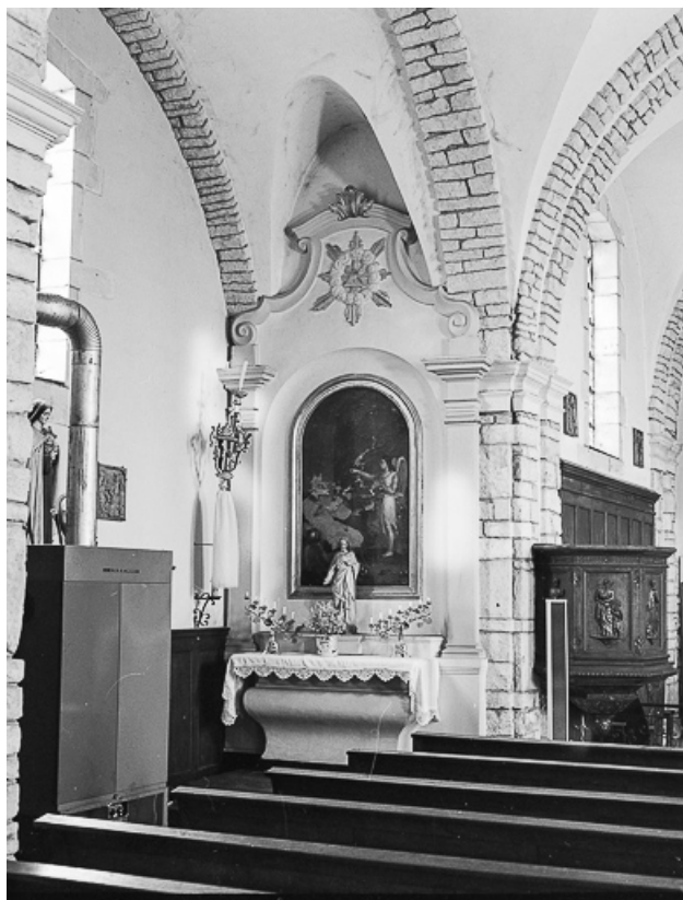
Autel-retable gauche : vue d'ensemble.