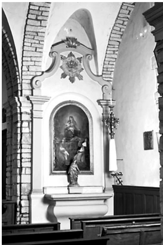
Autel-retable droit : vue d'ensemble.