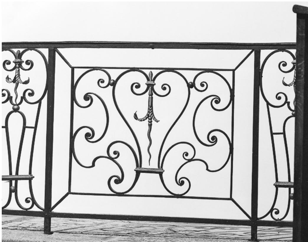
Détail d'un panneau.