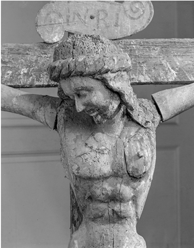
Détail : tête du Christ.