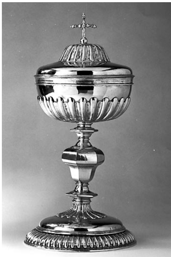
Vue d'ensemble. 70, Pesmes Portail