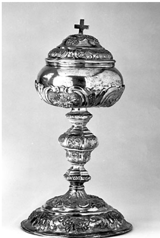
Vue d'ensemble. 70, Pesmes Portail