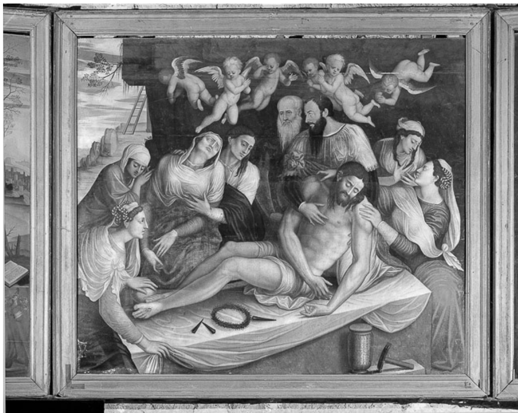
Détail : la Mise au tombeau.