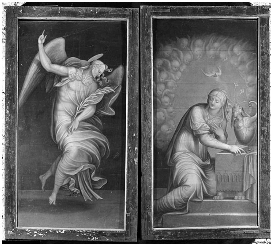
Vue d'ensemble volets fermés : l'Annonciation.