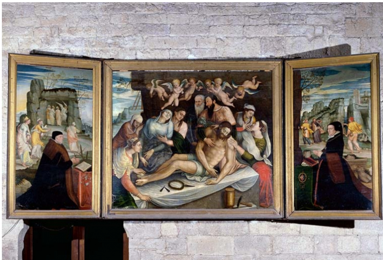
Vue d'ensemble volets ouverts.