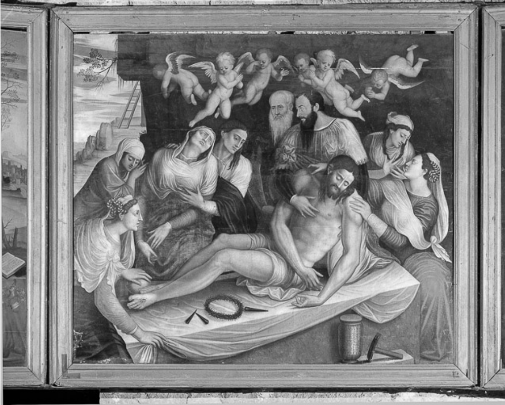
Détail : la Mise au tombeau.