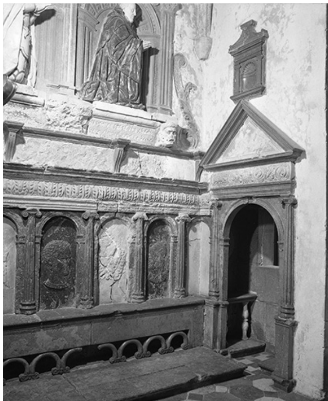
Façade ouest de la chapelle.