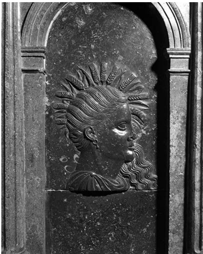
Détail : bas-reliefs n°4.