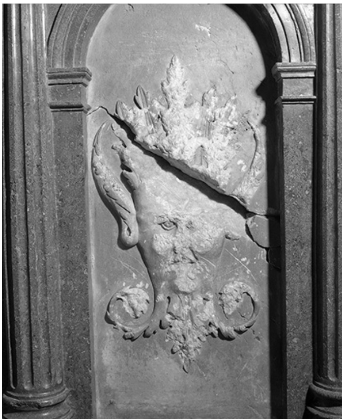
Détail : bas-reliefs n°3.