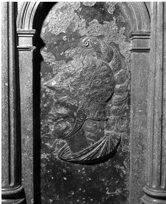
Détail : bas-reliefs n°8.