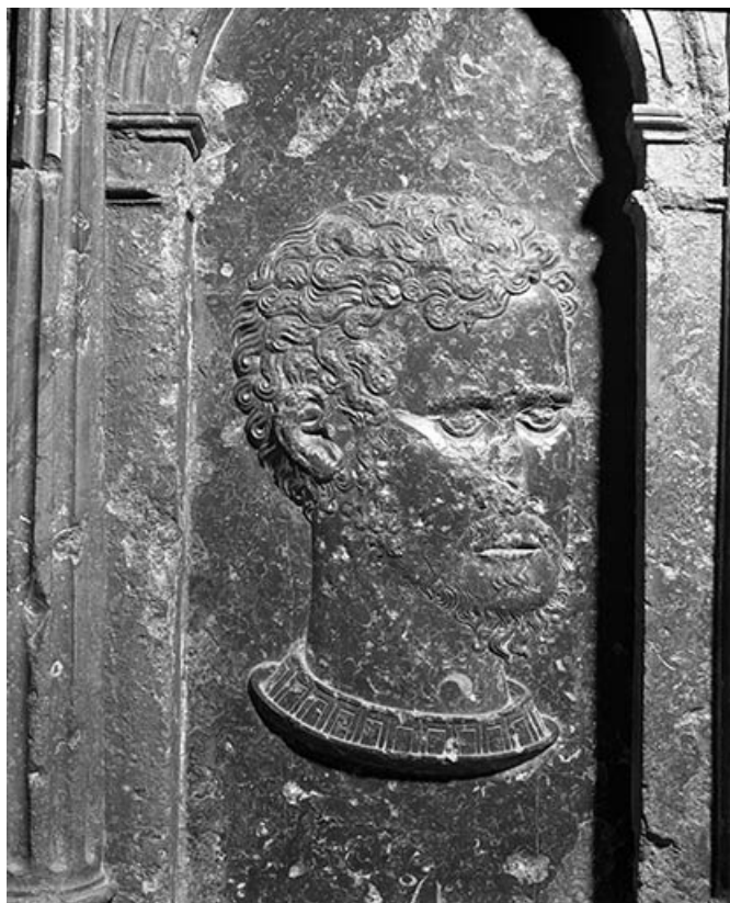
Détail : bas-reliefs n°12.