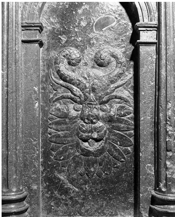
Détail : bas-reliefs n°10.