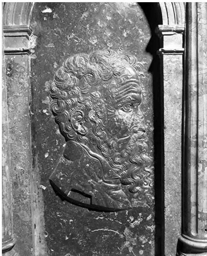
Détail : bas-reliefs n°6.