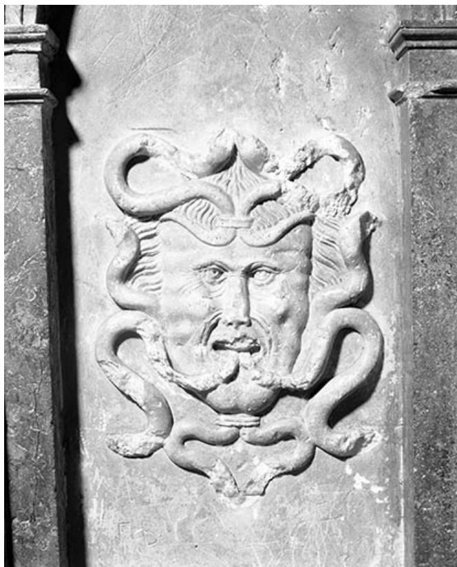
Détail : bas-reliefs n°7.