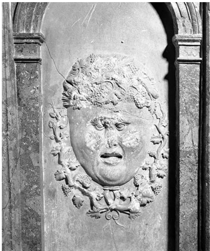
Détail : bas-reliefs n°5.