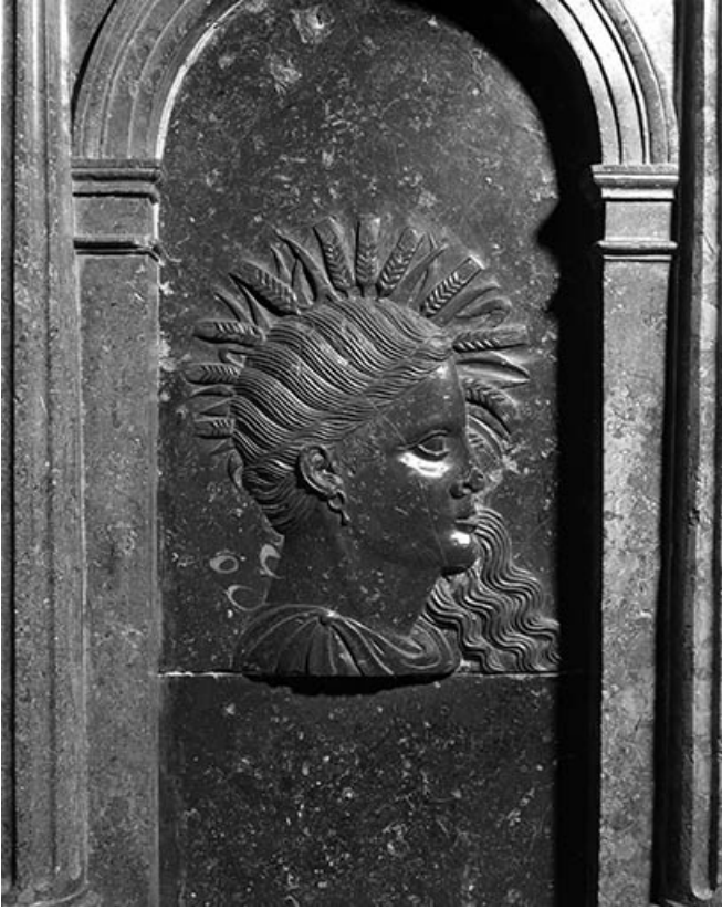
Détail : bas-reliefs n°4.