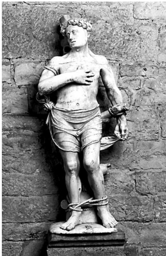
Vue de face.