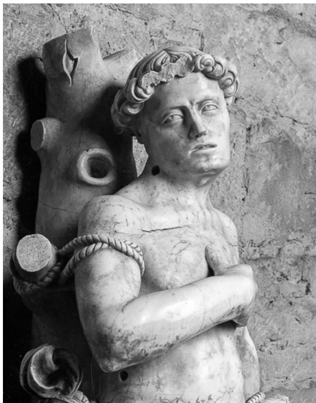
Détail : buste de trois quarts gauche.