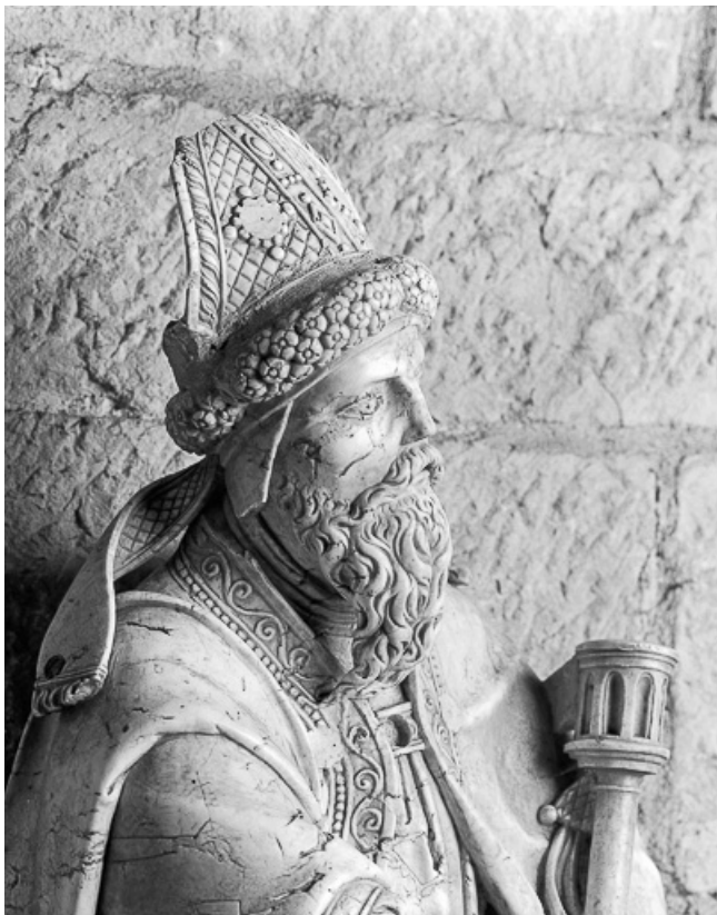
Détail : tête de trois quarts gauche.