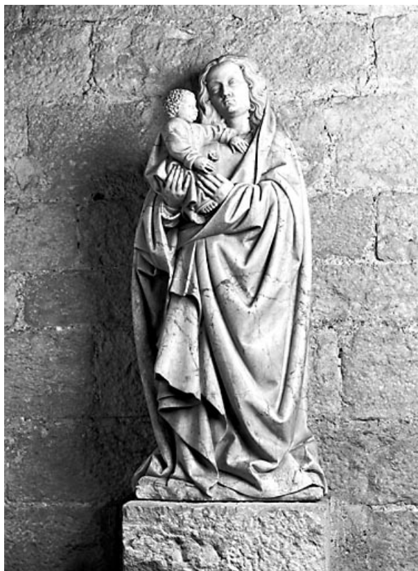
Vue de face.