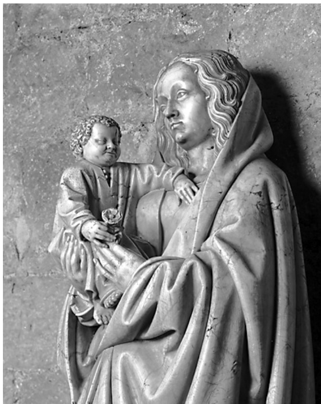
Détail : buste de la Vierge de trois quarts droit.