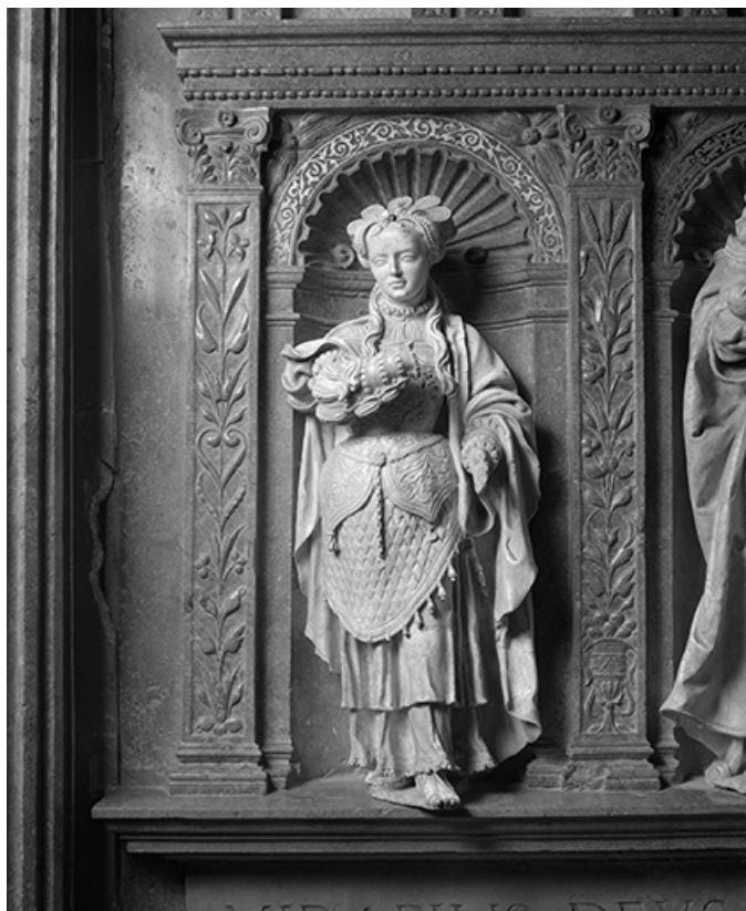
Détail : femme de gauche.