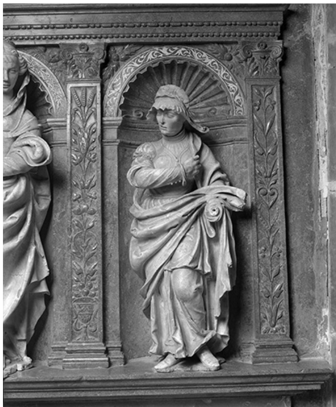
Détail : femme de droite.