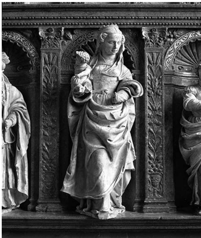
Détail : Vierge à l'Enfant.