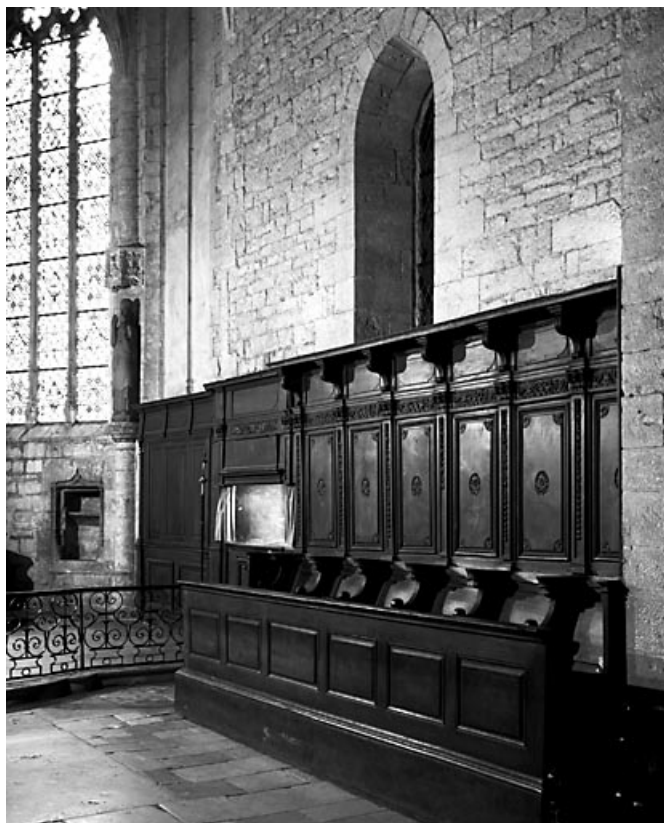
Vue d'ensemble des stalles de la droite du choeur.