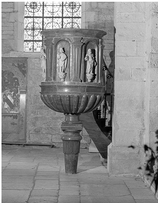
Vue d'ensemble sans la rampe d'escaliers.