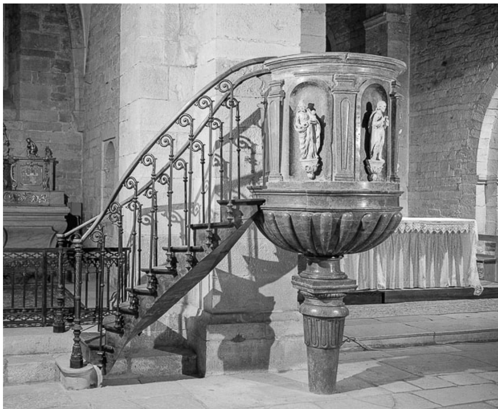
Vue d'ensemble avec la rampe d'escaliers.