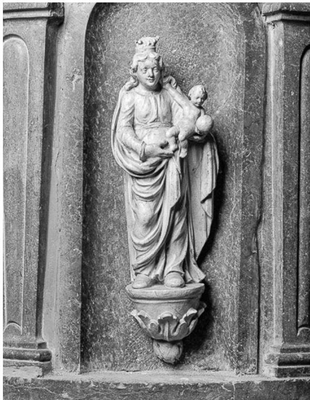
Détail de la cuve : statuette de Vierge à l'Enfant.