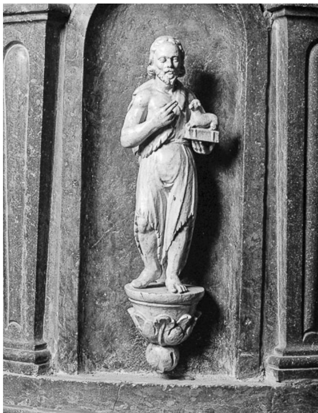
Détail de la cuve : statuette de Saint Jean Baptiste.