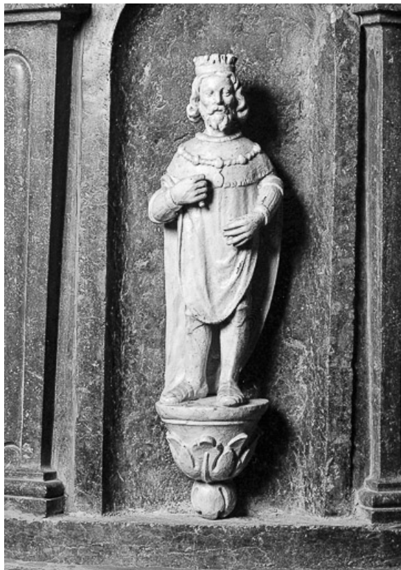
Détail de la cuve : statuette de Saint Louis.