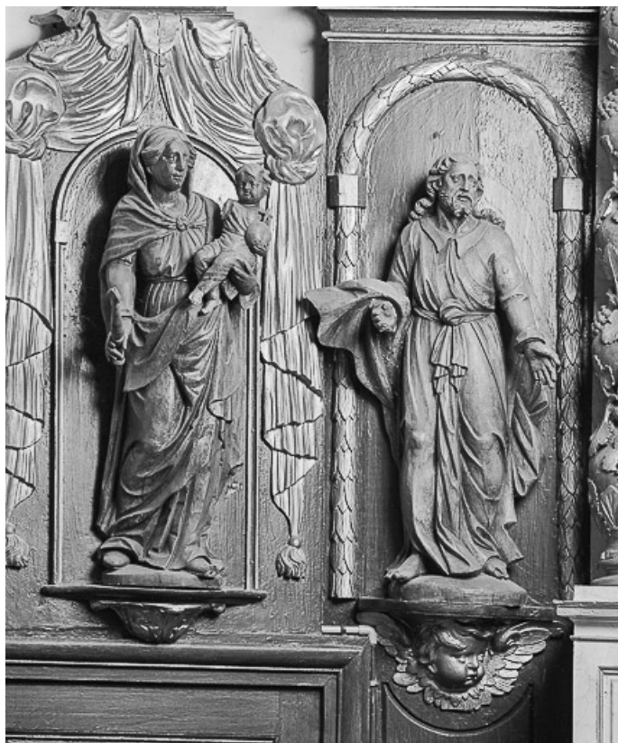
Vierge à l'Enfant et le Christ de face.