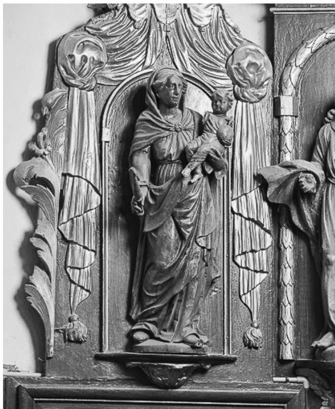
Vierge à l'Enfant. 70, Motey-Besuche