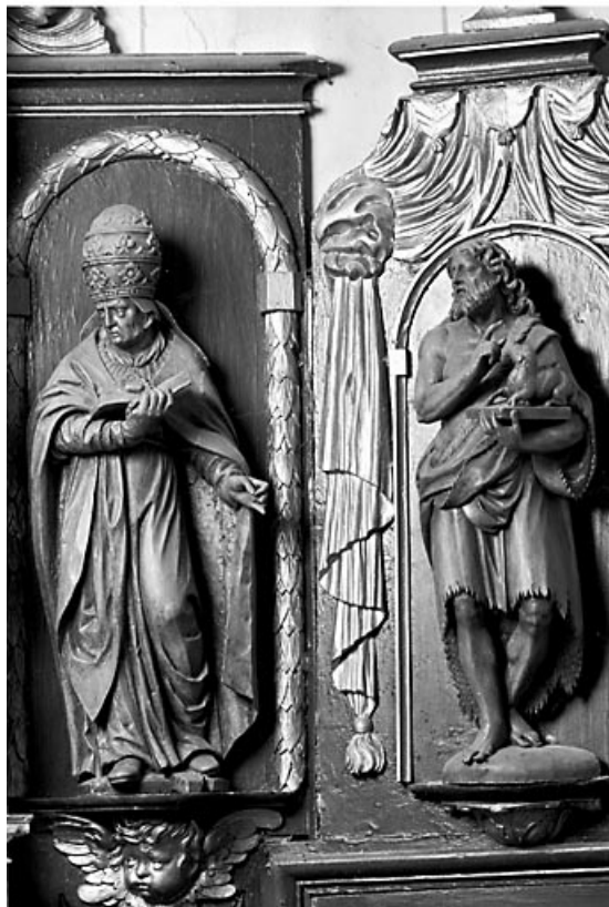
Vue de face d'un pape et de saint Jean-Baptiste. 70, Motey-Besuche