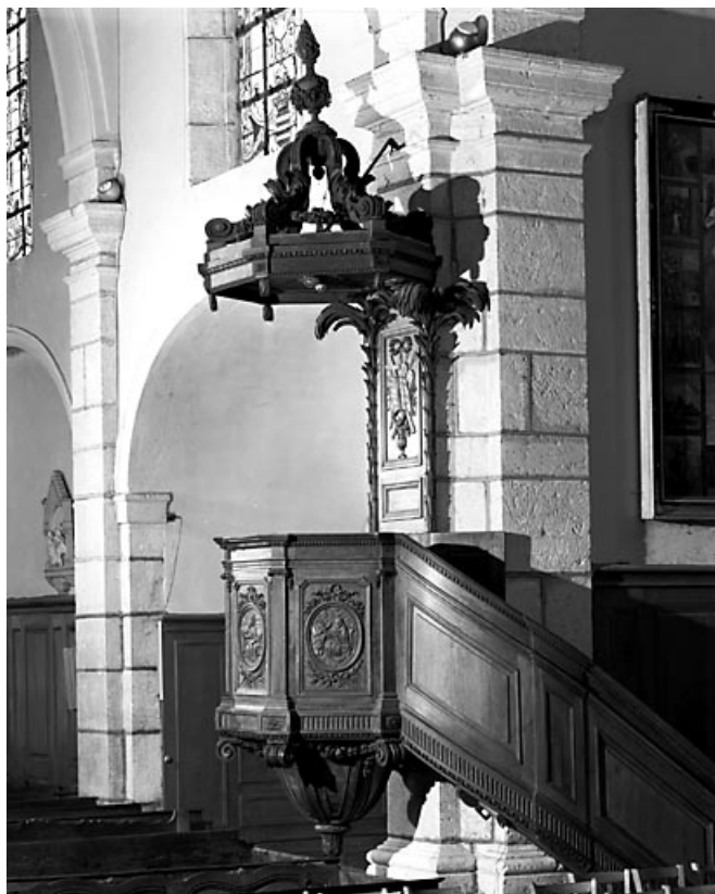
Vue d'ensemble. 70, Montagney