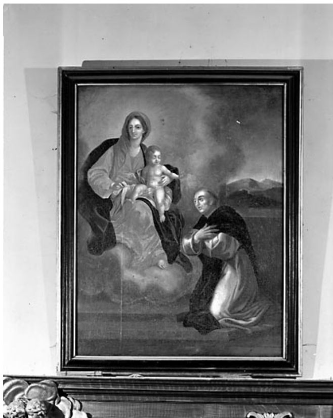
Vue d'ensemble. 70, Montagney