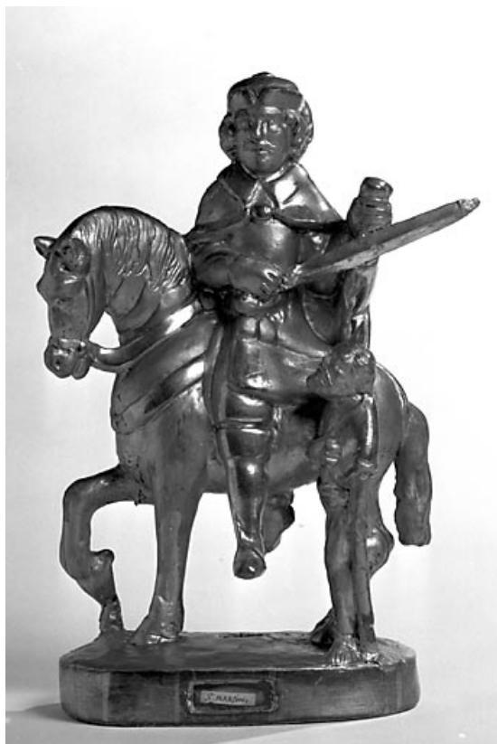
Vue d'ensemble de la statuette sans le coffret. 70, Montagney