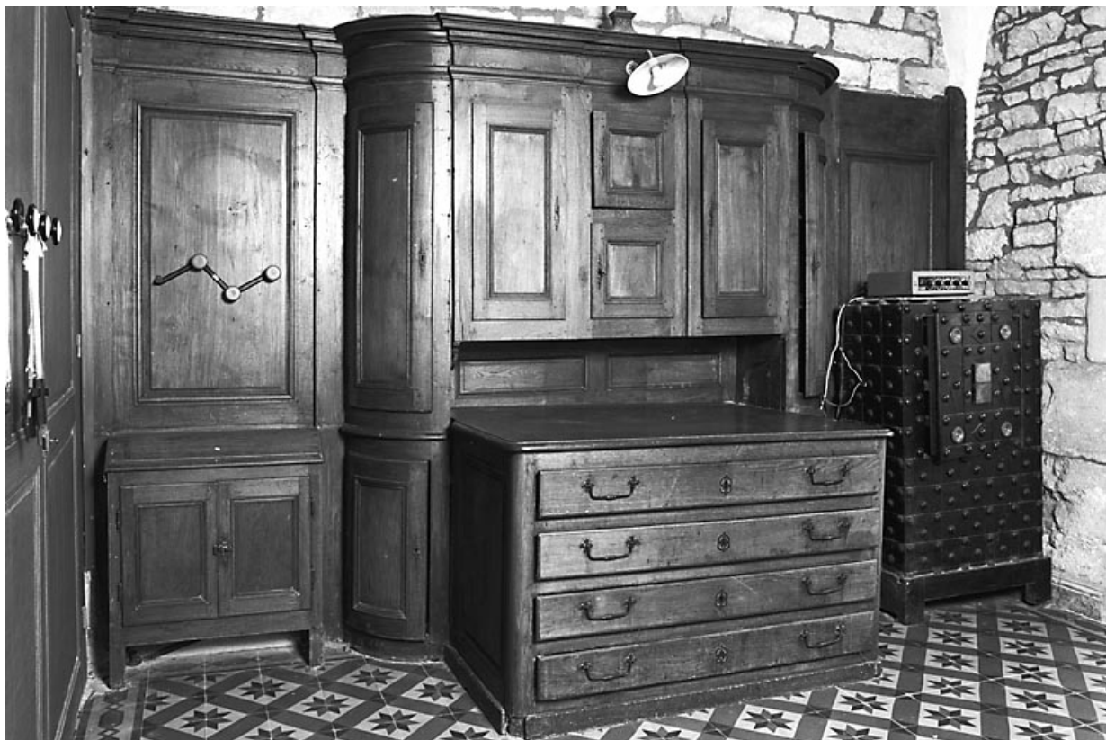
Vue d'ensemble. 70, Montagney