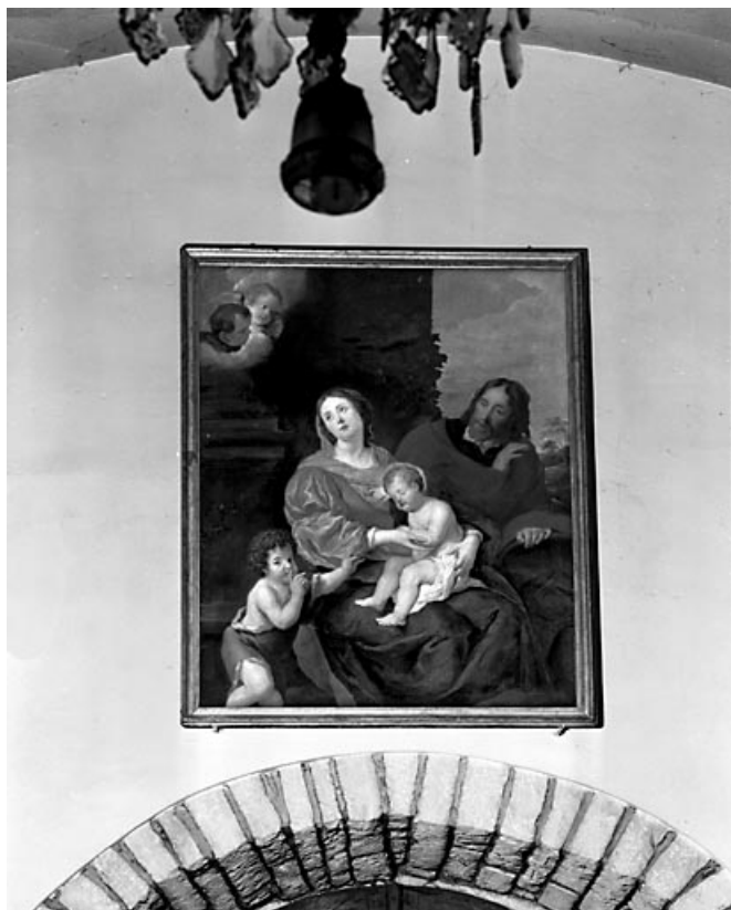
Vue d'ensemble. 70, Malans