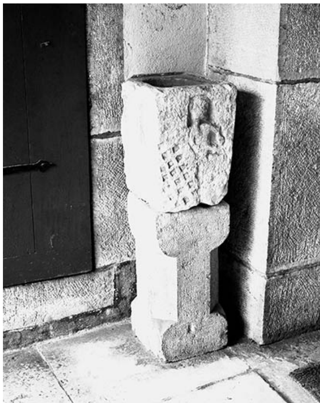
Vue d'ensemble. 70, Malans