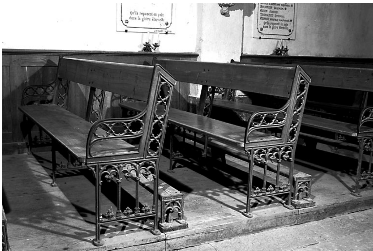
Vue de deux bancs.