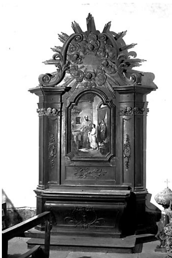
Vue d'ensemble de l'autel-retable gauche. 70, Lieucourt