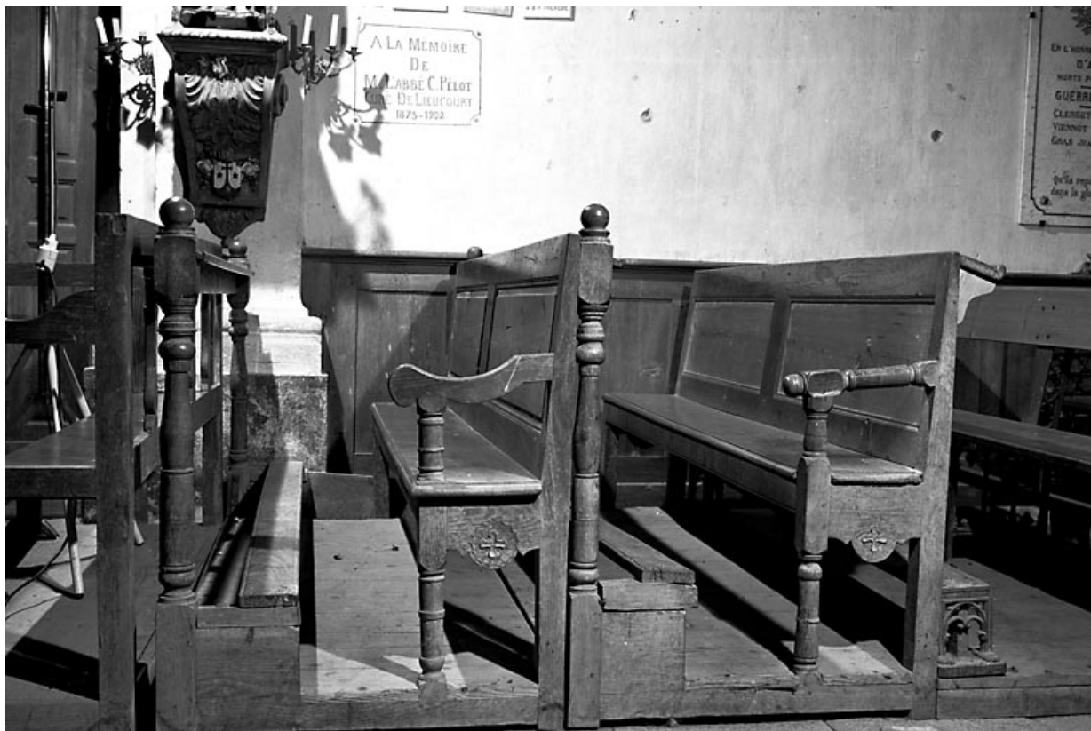
Vue de deux bancs.