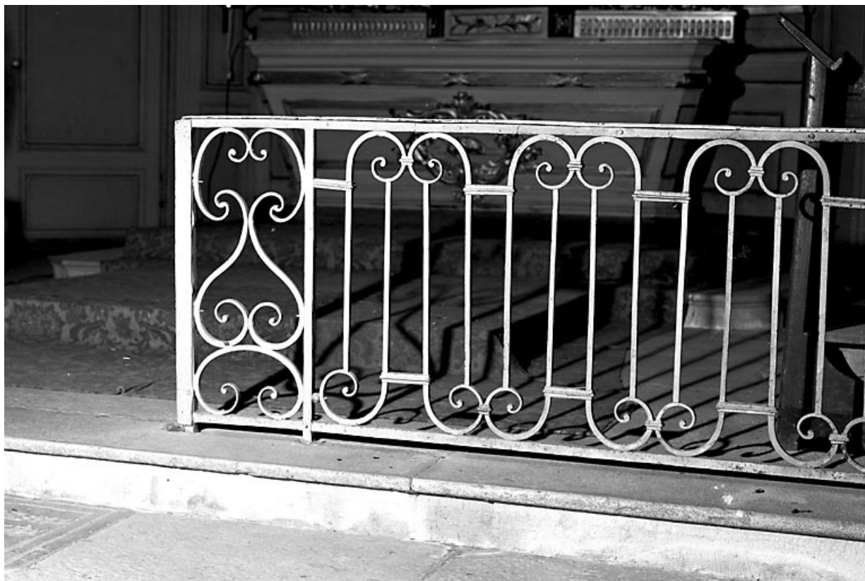
Vue de la partie droite.