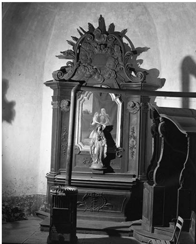
Vue d'ensemble de l'autel-retable droit. 70, Lieucourt