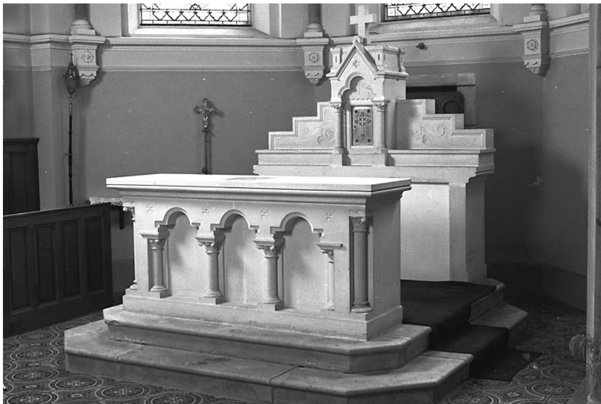
Vue d'ensemble du maître-autel.