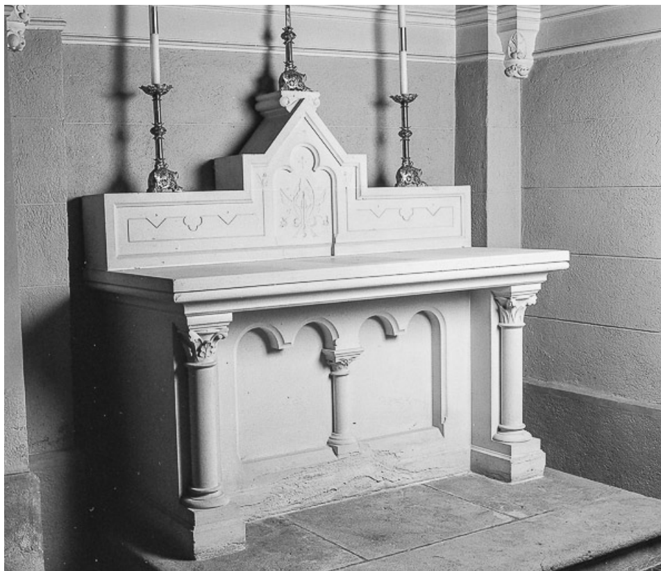
Autel latéral droit : vue d'ensemble.