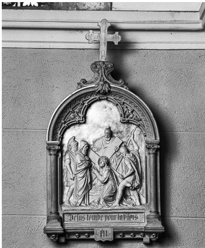
Chemin de croix : station 3