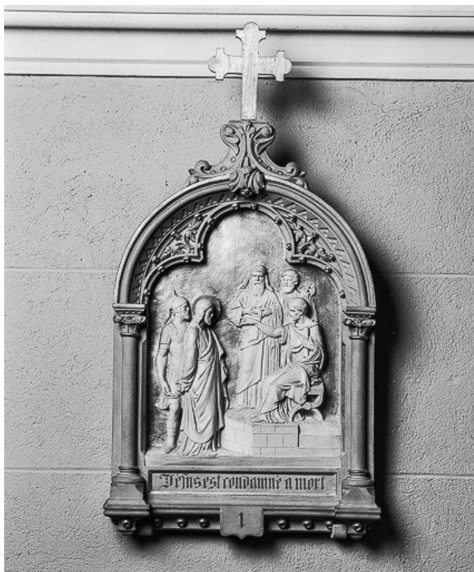
Chemin de croix : station 1