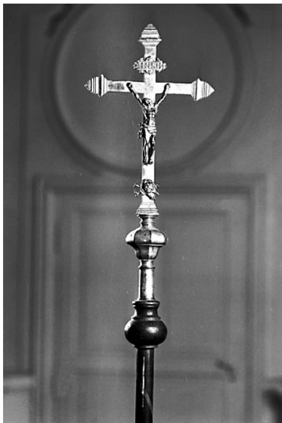
Vue de face.