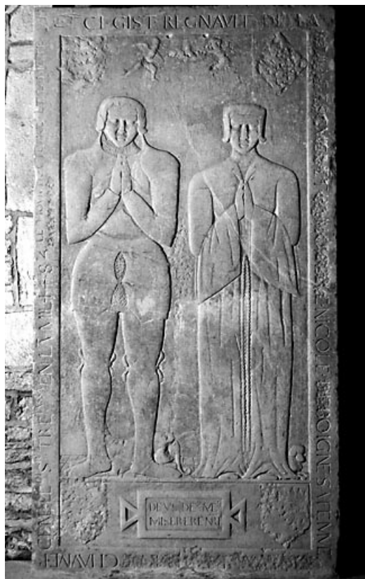
Vue d'ensemble. 70, Chaumerenne