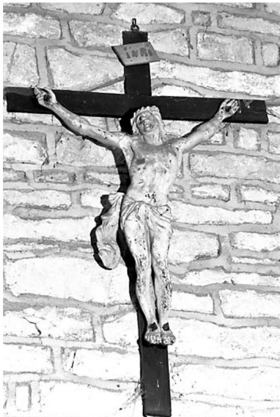
Vue d'ensemble. 70, Chaumerenne