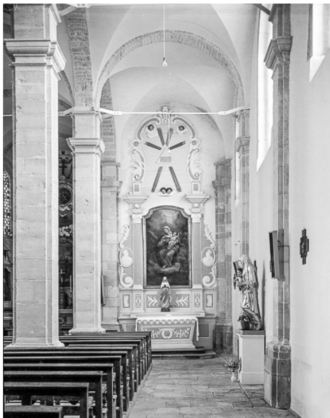
Vue d'ensemble de l'autel-retable latéral gauche.