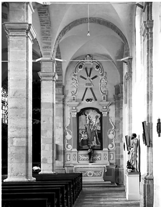
Vue d'ensemble de l'autel-retable latéral droit.