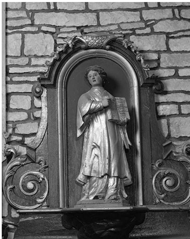
Le diacre : vue d'ensemble.