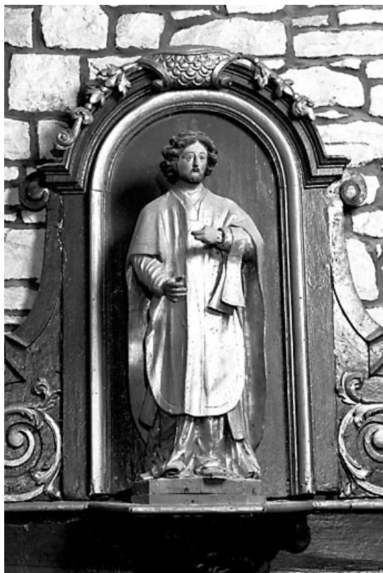
Vue de face du prêtre.