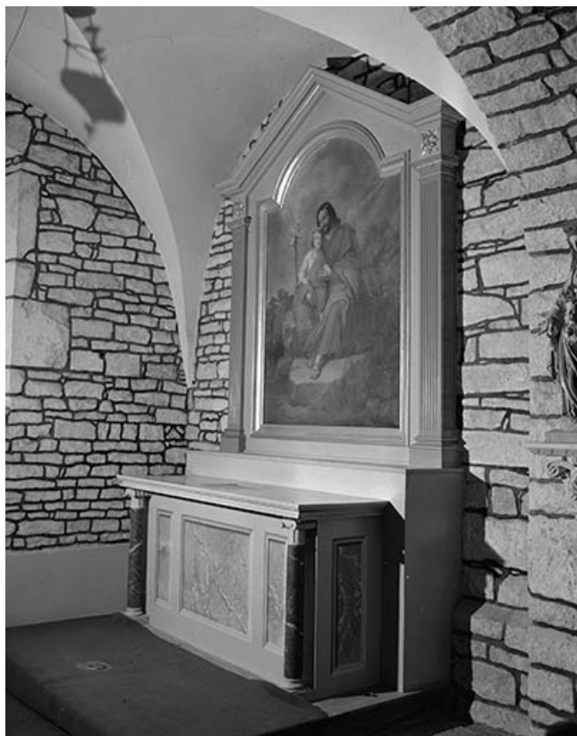
Autel-retable latéral gauche : vue d'ensemble.