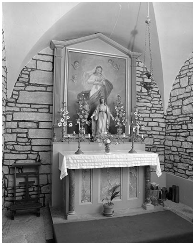
Autel-retable latéral droit : vue d'ensemble.