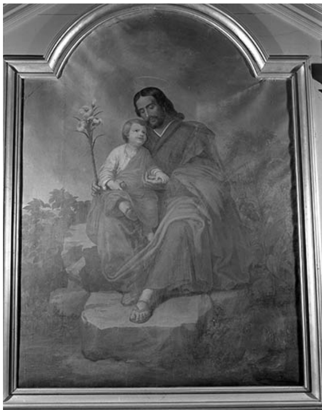
Autel-retable latéral gauche : détail peinture sur toile : saint Joseph et l'Enfant-Jésus. 70, Bard-lès-Pesmes Grande Rue