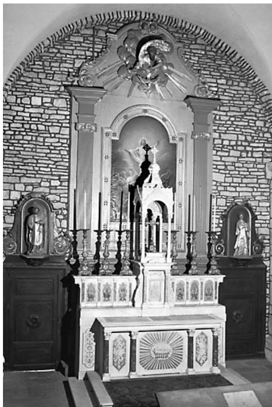
Vue d'ensemble du maître-autel.