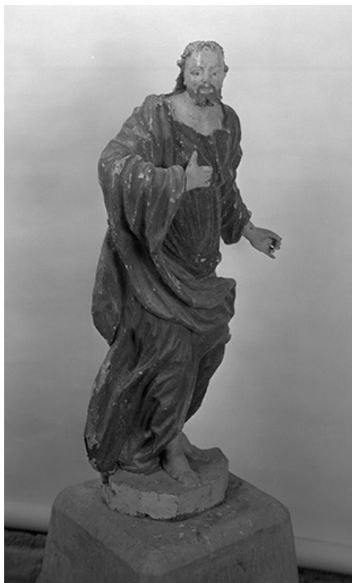
Vue de trois quart droit.