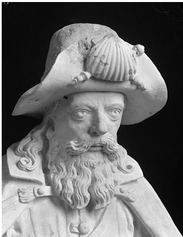
Détail : visage de trois quarts droit.