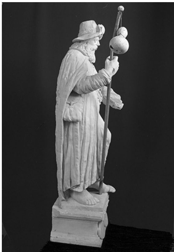
Vue de profil droit.