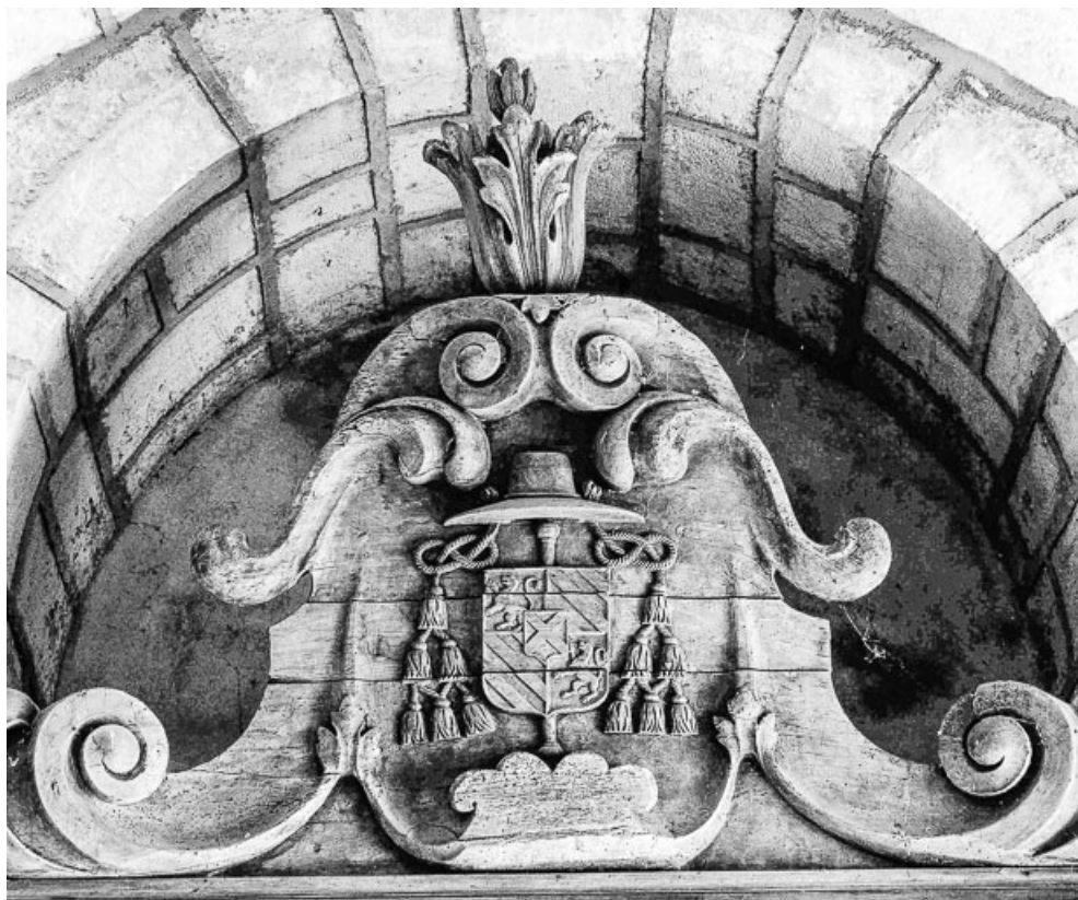
Détail : couronnement.