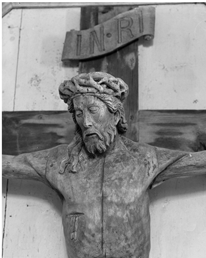
Détail : buste et tête du Christ.