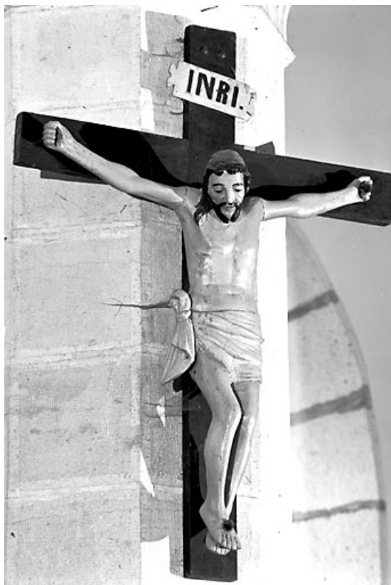
Vue générale. 70, Charcenne