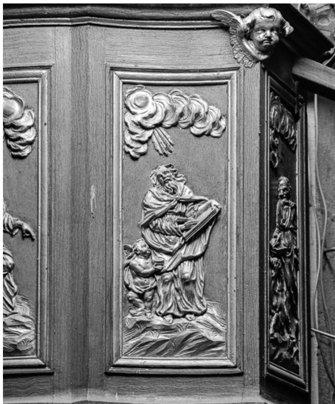
Détail panneau de la cuve : saint Matthieu. 70, Charcenne