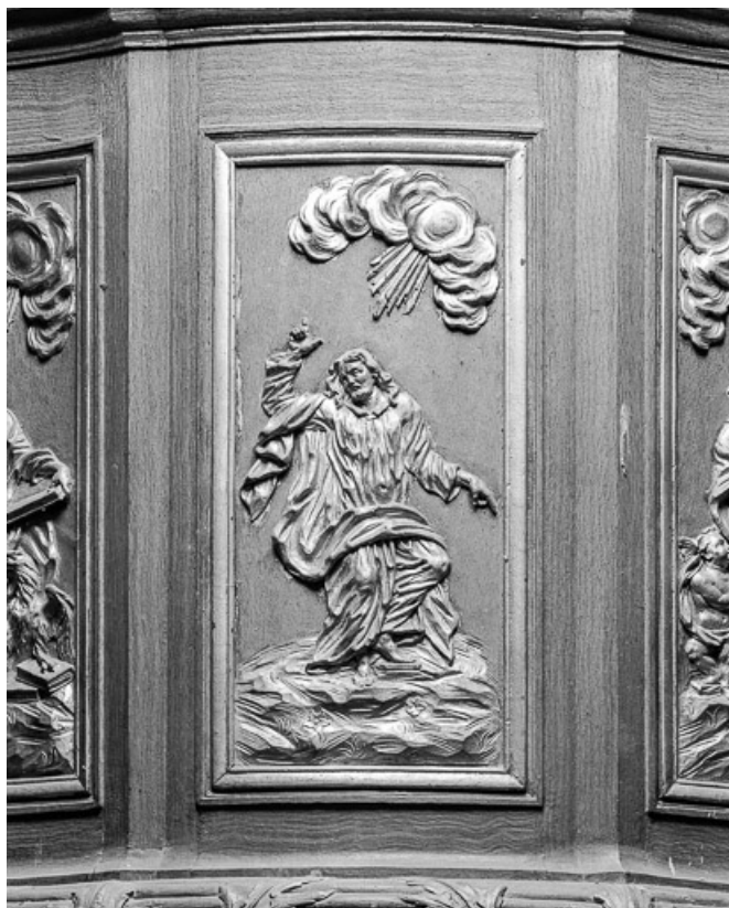
Détail panneau de la cuve : le Christ.