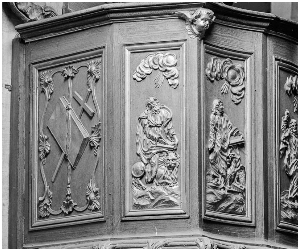
Détail panneau de la cuve : saint Marc. 70, Charcenne