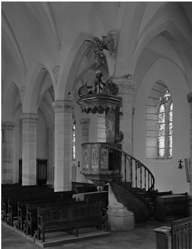
Vue de trois quart droit.