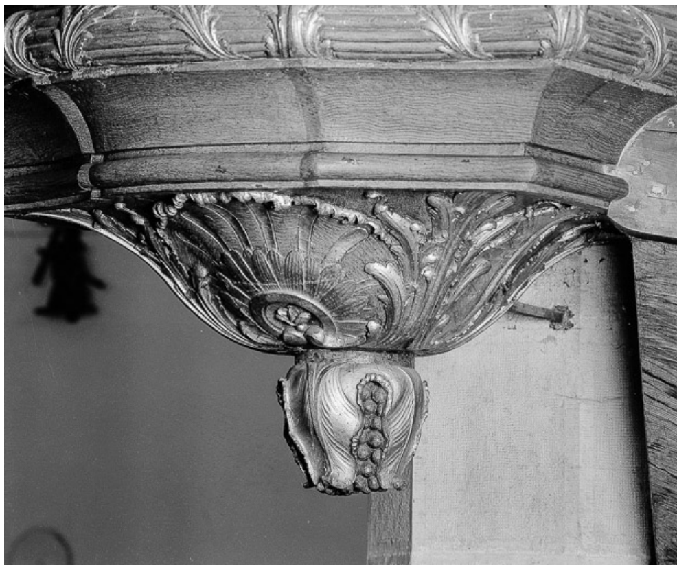
Détail : culot. 70, Charcenne