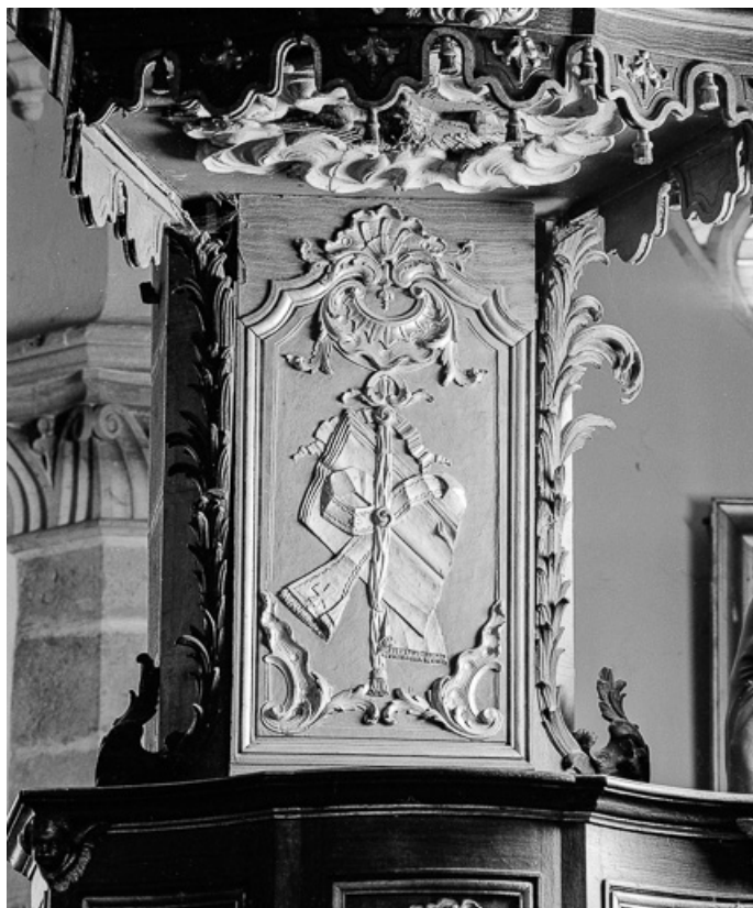
Détail : dorsal. 70, Charcenne