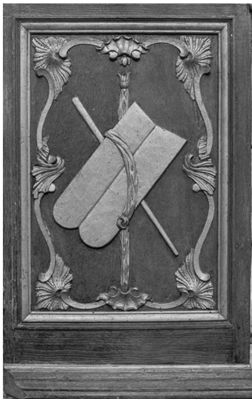
Détail : portillon de la cuve.