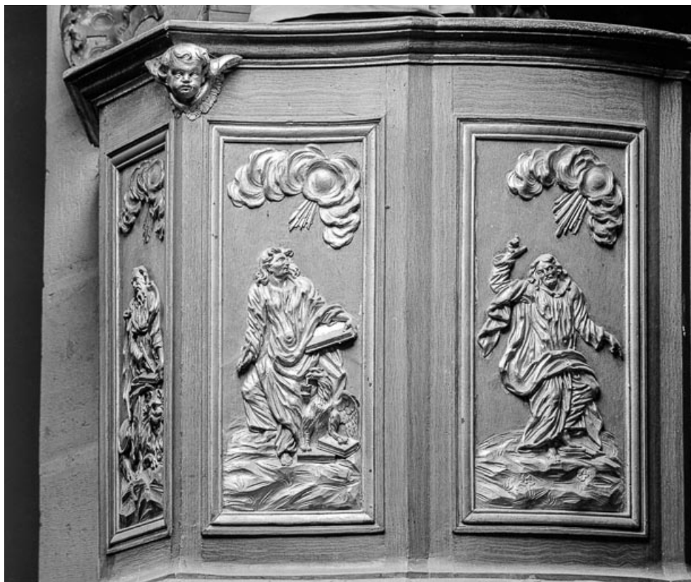
Détail panneau de la cuve : saint Jean. 70, Charcenne