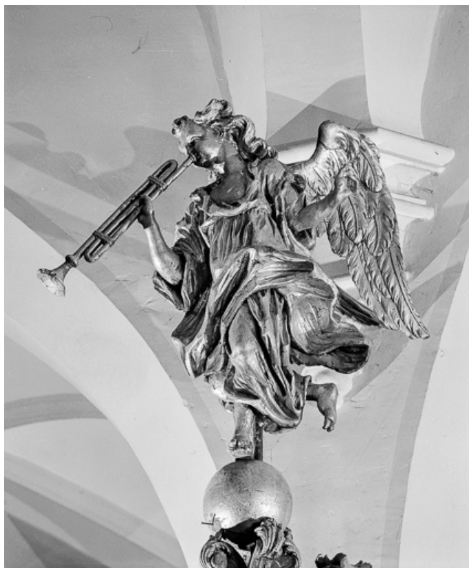
Détail : ange musicien surmontant l'abat-voix. 70, Charcenne