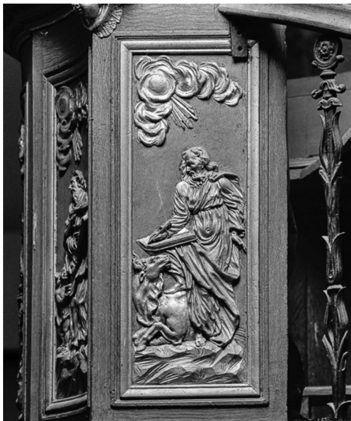
Détail panneau de la cuve : saint Luc. 70, Charcenne