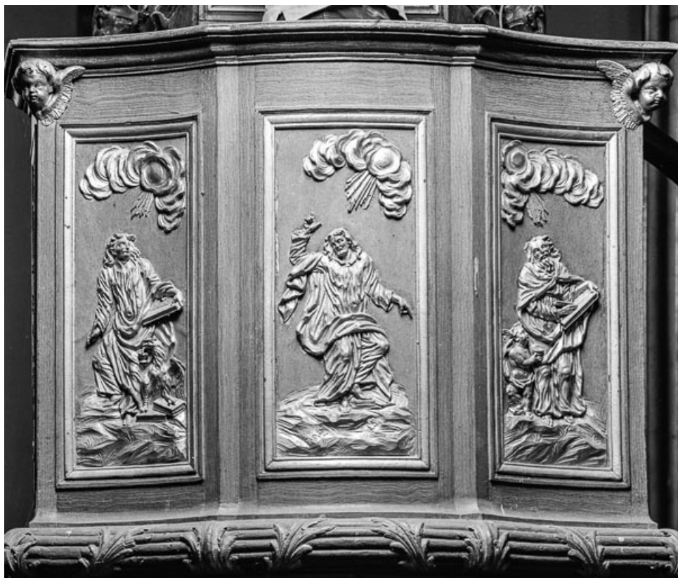
Détail : trois panneaux de la cuve : saint Jean, le Christ et saint Matthieu. 70, Charcenne