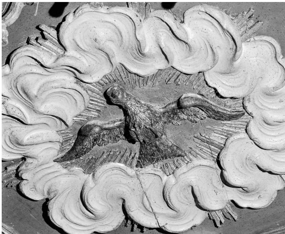
Détail : plafond de l'abat-voix. 70, Charcenne