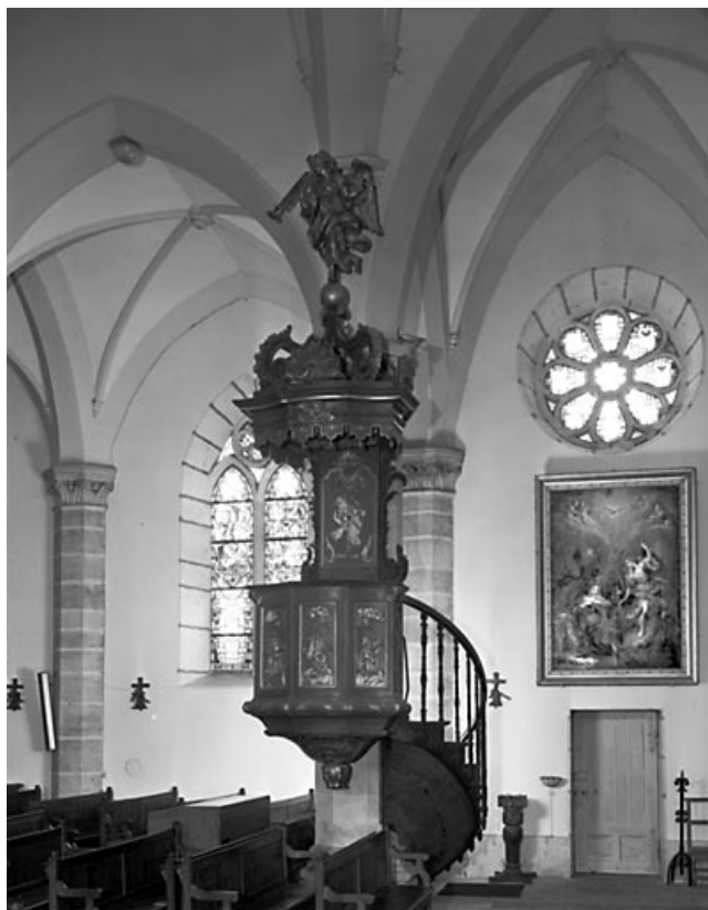
Vue d'ensemble. 70, Charcenne