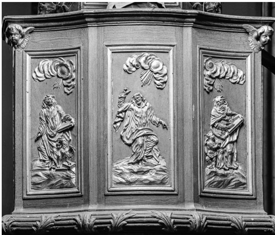
Détail : trois panneaux de la cuve : saint Jean, le Christ et saint Matthieu. 70, Charcenne