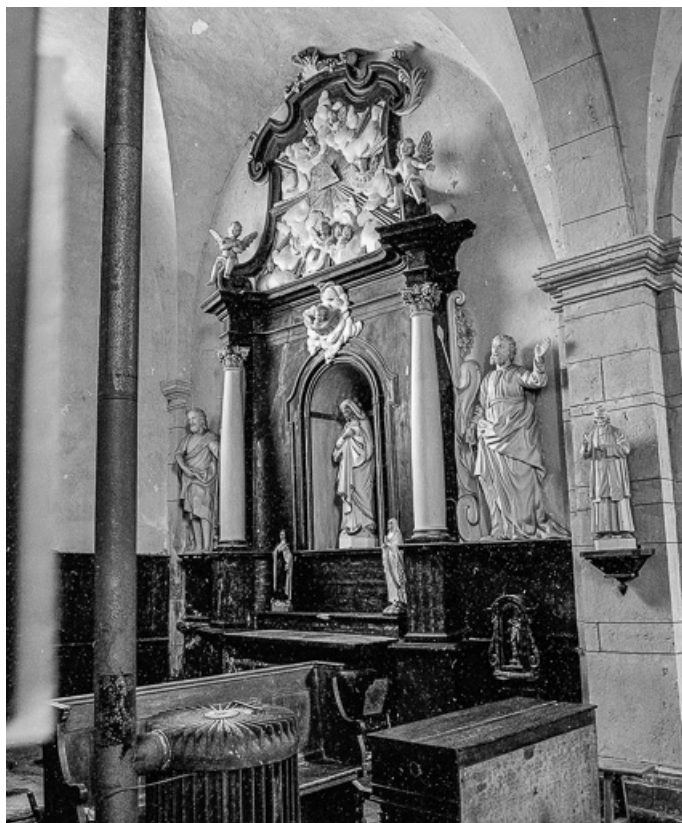
Vue générale de l'autel-retable latéral gauche. 70, Tromarey