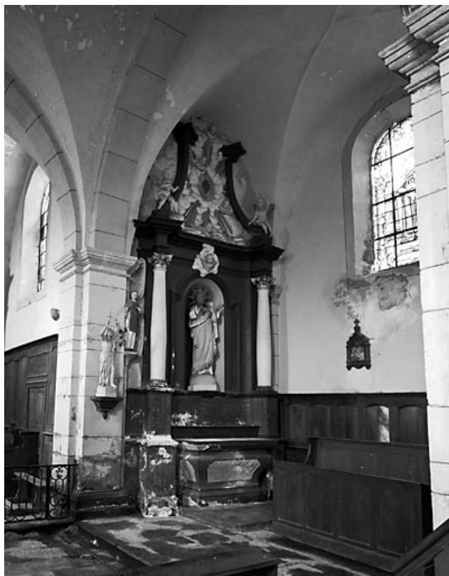
Vue générale de l'autel-retable latéral droit. 70, Tromarey