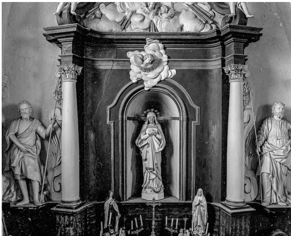
Détail de l'autel retable latéral gauche. 70, Tromarey