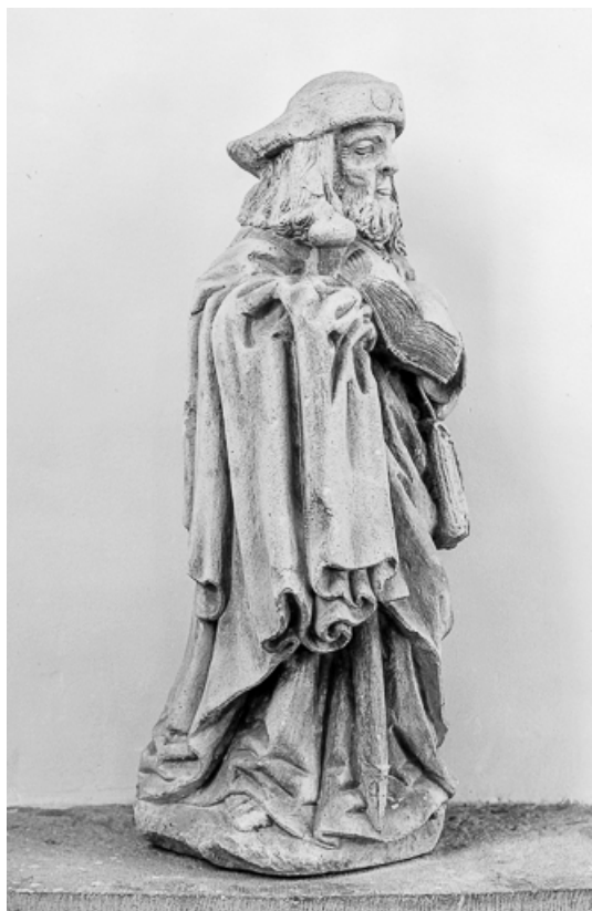
Vue de trois quart droit.