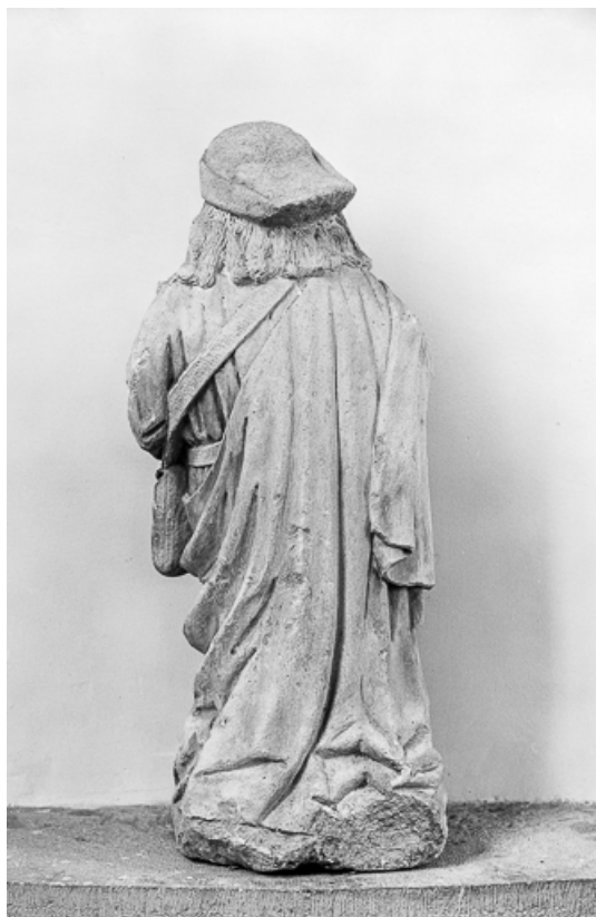
Vue de dos.