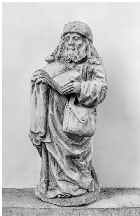
Vue de trois quart gauche.