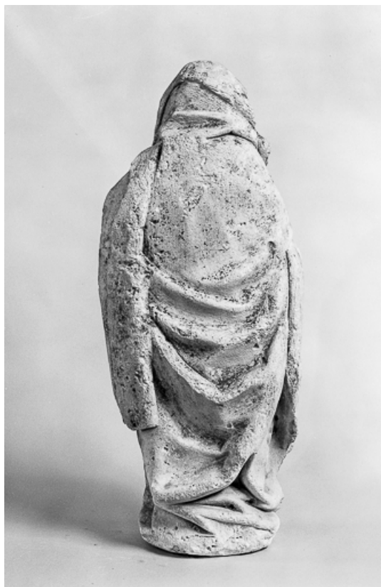
Vue de dos.