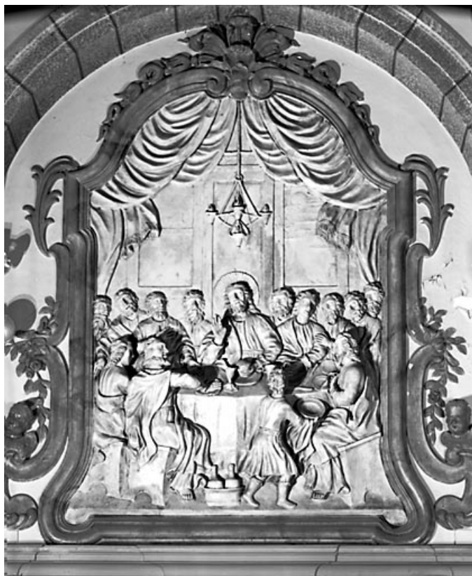
Vue générale de la Cène.