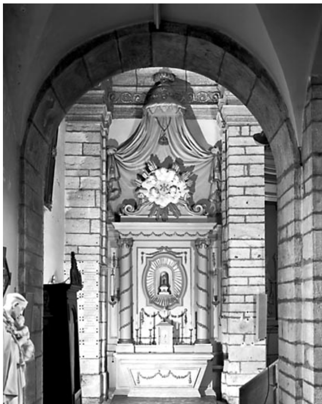
Vue d'ensemble de l'autel-retable latéral gauche.