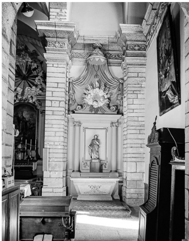
Vue d'ensemble de l'autel-retable latéral droit.