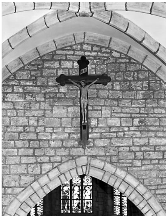
Vue générale. 70, Marnay