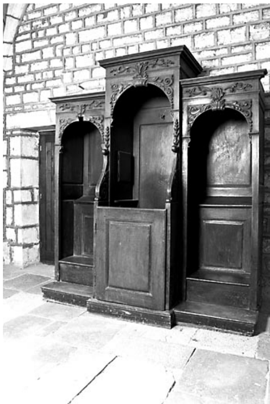
Vue générale. 70, Marnay