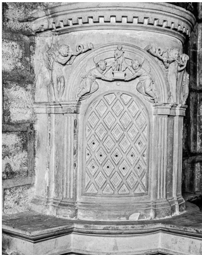
Ciborium droit : partie centrale à gauche. 70, Marnay