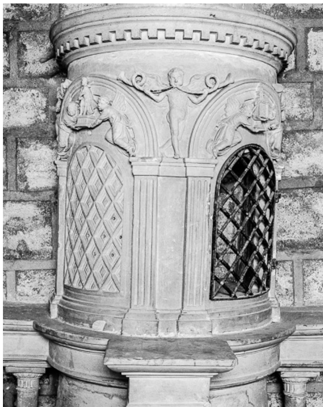
Ciborium droit : partie centrale. 70, Marnay