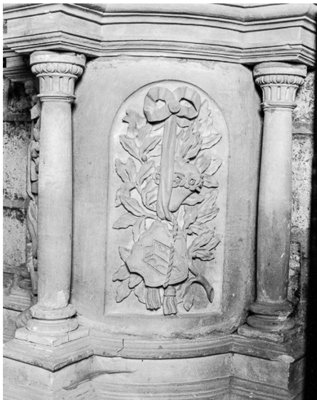
Ciborium gauche : partie inférieure droite. 70, Marnay