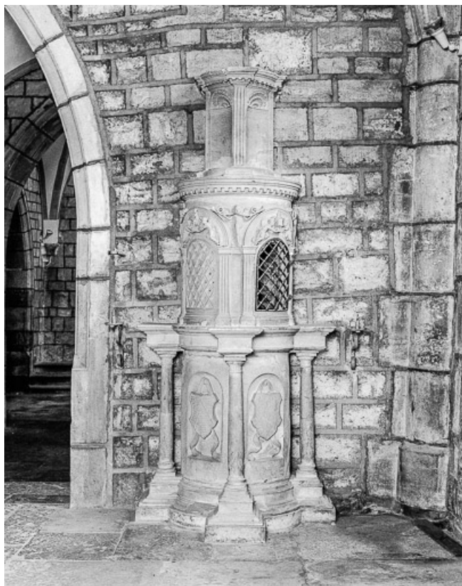
Ciborium droit : vue d'ensemble.