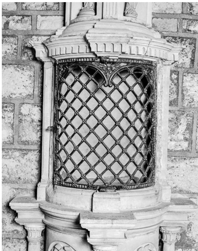
Ciborium gauche : partie centrale. 70, Marnay