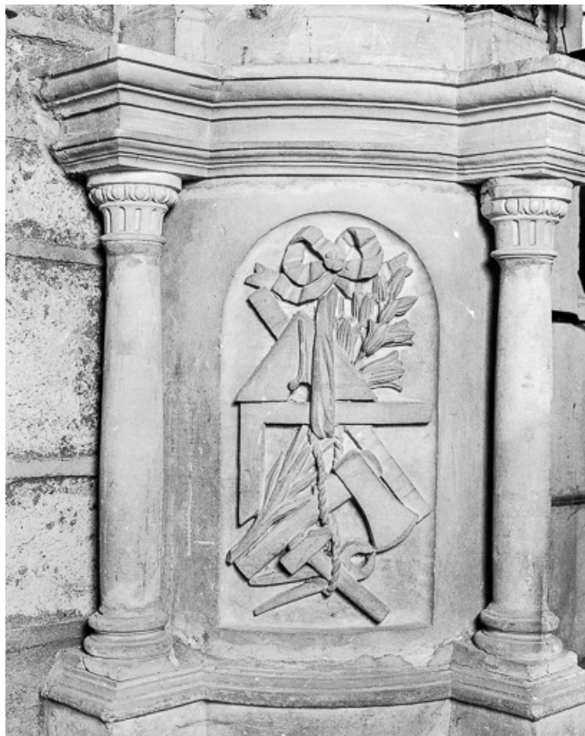
Ciborium gauche : partie inférieure gauche. 70, Marnay