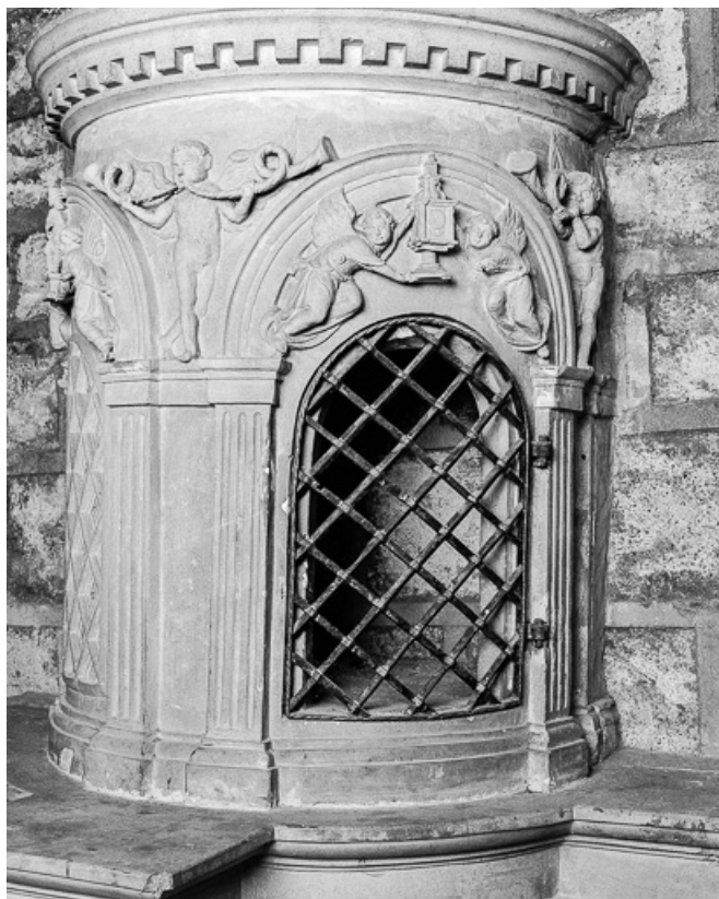
Ciborium droit : partie centrale à droite. 70, Marnay