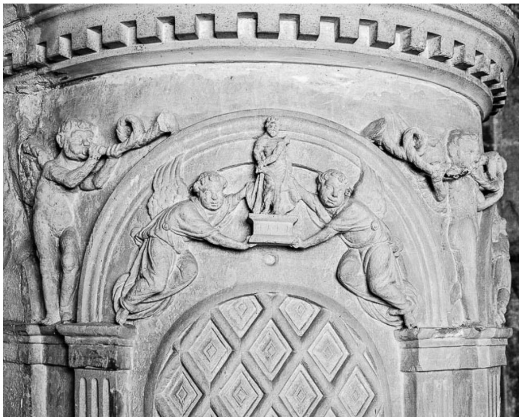
Ciborium droit : détail de la partie centrale à droite. 70, Marnay