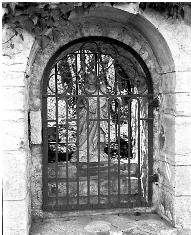
Vue de face. 70, Cult