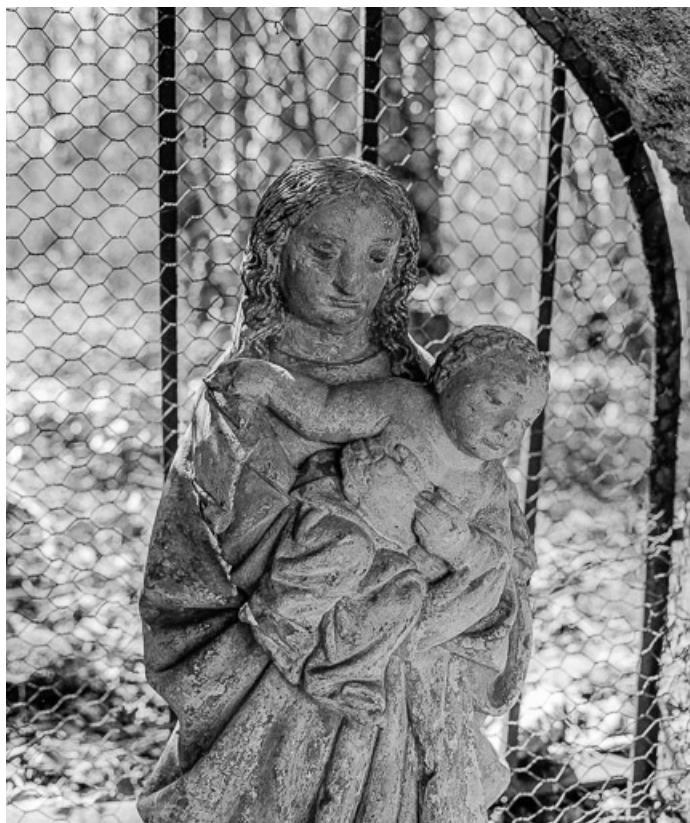
Vierge à l'enfant : à mi-corps.