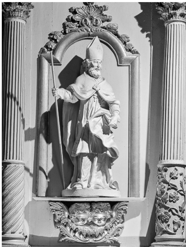
Vue de l'évêque de droite.