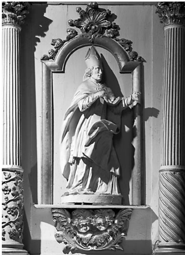
Vue de l'évêque de gauche.