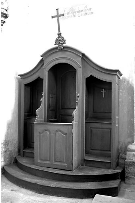
Vue générale du confessionnal gauche. 70, Courcuire