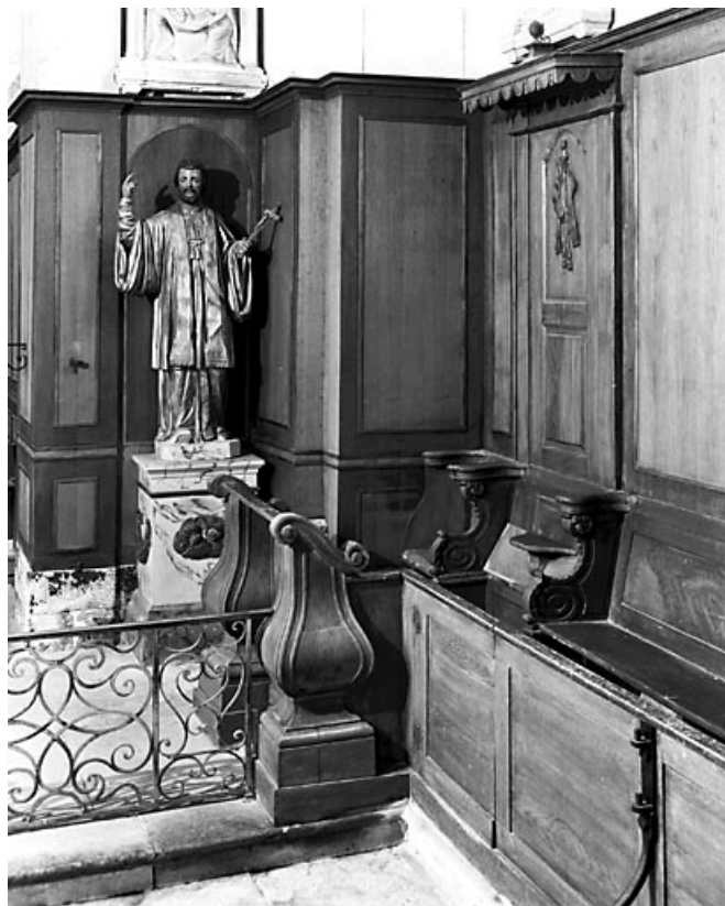
Vue générale de la stalle gauche.