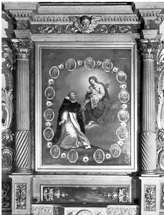
Autel latéral gauche : tableau la Donation du rosaire à saint Dominique. 70, Brussey