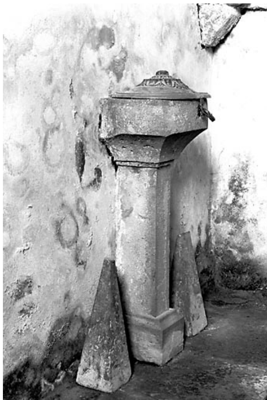
Vue générale de trois quarts droit.