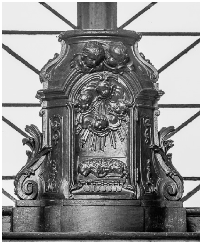
Tabernacle vu de face.